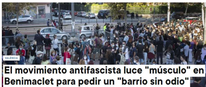
El movimiento antifascista luce "músculo" en Benimaclet para pedir un "barrio sin odio"

Olvida el Tío la Vara que, con la inconsciencia que caracteriza a los jóvenes, idénticas fiestas que las del Galileo Galilei se han celebrado en toda España, incluida su admirada Cataluña. Pero el Tío la Vara vomita odio sobre estos universitarios, a los que acusa de provocar "el mayor